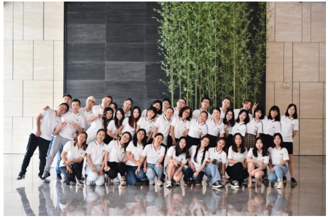
Sunny Worldwide Logistics Team.