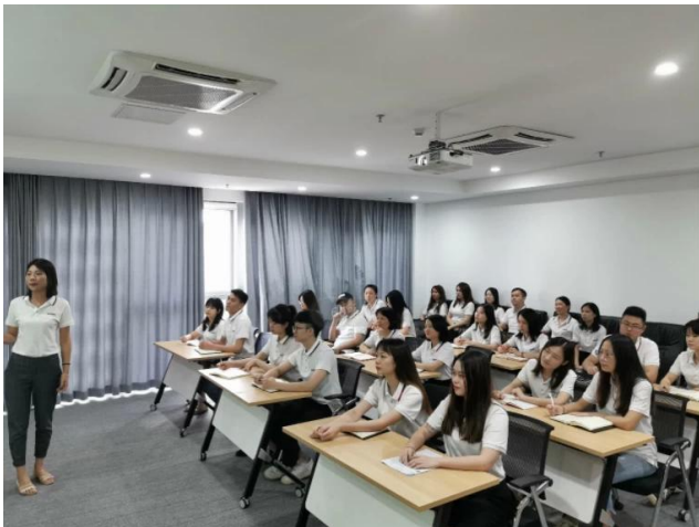
Departamento ng pagbebenta

Sunny Worldwide Logistics.... ikaw ay Pinakamahusay Sagot.