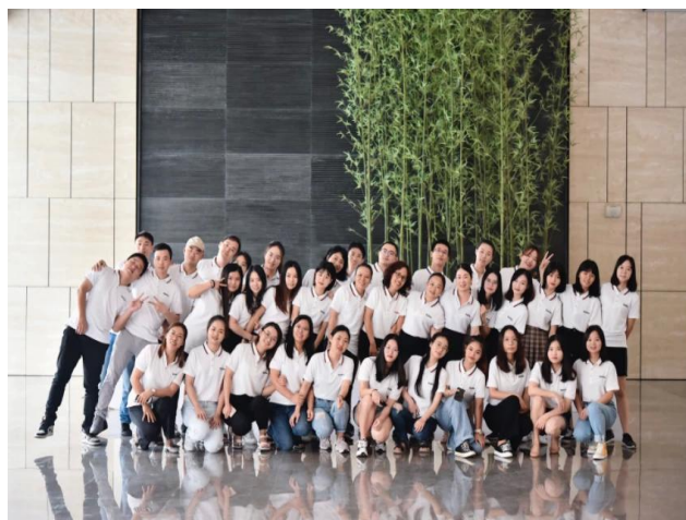
Sunny Worldwide Logistics Team.