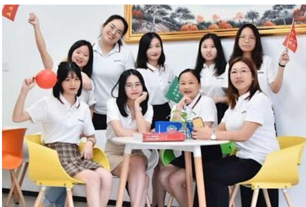
Kagawaran ng Operasyon