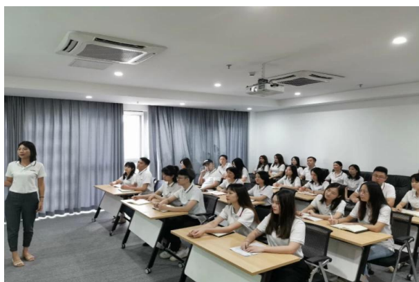
Kagawaran ng Pagbebenta

Sunny Worldwide Logistics ay iyong PinakamahUSAy sagot.