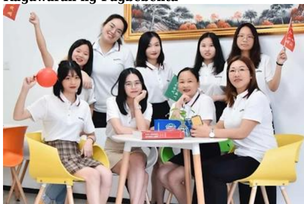
Kagawaran ng Operasyon