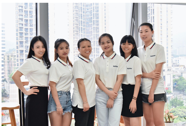
Kagawaran ng Marketing