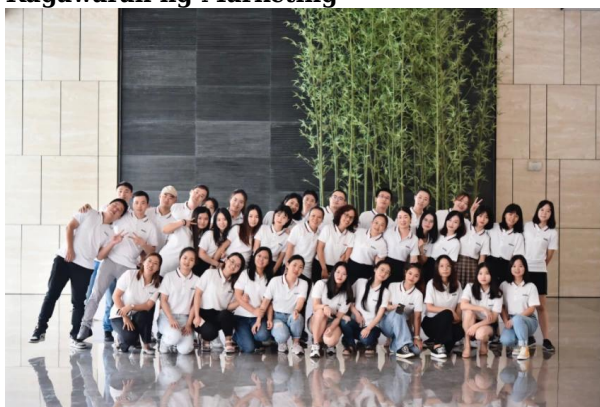
Sunny Worldwide Logistics Team

Narito ang gabay sa gawin ang iyong quote ng kargamento