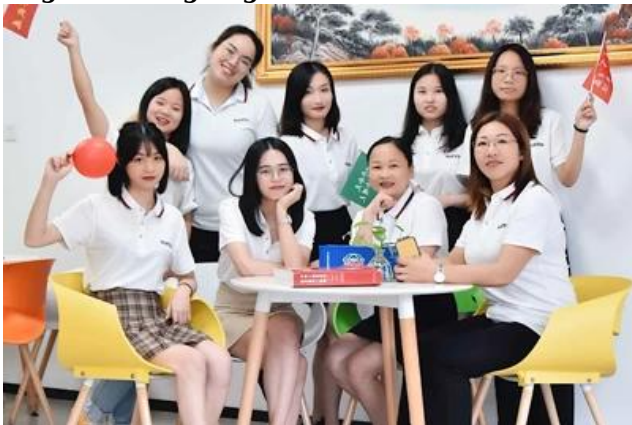
Kagawaran ng Operasyon