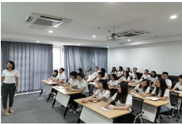
Kagawaran ng Pagbebenta

Sunny Worldwide Logistics ay iyong Pinakamahusay sagot.