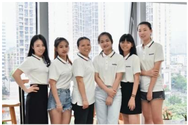
Kagawaran ng Marketing